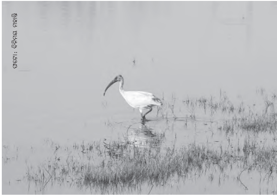
ପକ୍ଷୀ: ବିଜିମୟ ମହାନ୍ତି

୫୩ଟି ନଦନଦୀ ଚିଲିକାରେ ମିଶିଥିଲେ । ସେଗୁଡ଼ିକ ମଧ୍ୟରୁ ଅନେକ କାଳକ୍ରମେ ଭୂଗୋଳରୁ ସତ୍ତା ହରାଇ ବସିଲେ । ଲୁଣା ଓ ମଧୁର ଜଳର ସମନ୍ୱୟରେ ଯେଉଁ ସୁସଂହତ ପରିସଂସ୍ଥା ଗଢ଼ି ଉଠିଥିଲା, ତାହା ବାଧାପ୍ରାପ୍ତ ହେଲା । ନାଳ ଓ ନଦୀରେ ପ୍ରବାହିତ ହୋଇ ଆସୁଥିବା ପରୁମାଟି ଯେଉଁ ଜୀବ ଓ ଉଦ୍ଭିଦଙ୍କ ପାଇଁ ଖାଦ୍ୟ ଥିଲା ସେ ପ୍ରକ୍ରିୟା ହୋଇ ନପାରିବାରୁ ପ୍ରାକୃତିକ ଖାଦ୍ୟର ଅଭାବ ଉତ୍ତମ ଚଢ଼େଇ ଓ ମାଛ କଙ୍କଡ଼ାକୁ ଆଜି ନହେଲେ ବି କାଲି ହୁଏତ ଭୋଗିବାକୁ ପଡ଼ିପାରେ । ମାର୍ଚ୍ଚ ଶେଷ ପର୍ଯ୍ୟନ୍ତ ଚିଲିକାରେ ରହିବାକୁ ପସନ୍ଦ କରୁଥିବା ଚନ୍ଦନା ହଂସ (Eurasian Wigeon) ଜଳଜ ଉଦ୍ଭିଦ ଓ କଇଁ ଭଳି ନରମ ନାଡ଼ ସହ ଗେଣ୍ଡା ଓ ଯୋକ ଖାଇଥାଏ । କାଦୁଅ ପତ ପତ ମାଟି ଉପରେ ଚାଲିବାକୁ ଭଲପାଏ । ୨୦୦୫ ମସିହାରେ ଏସବୁ ଭରପୁର ଥିଲା । ସେହିବର୍ଷ ଏହି ପକ୍ଷୀଟିର ସଂଖ୍ୟା ୫୫